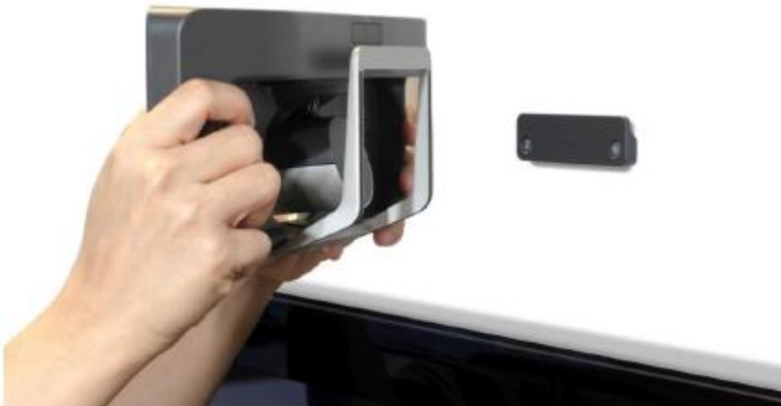
图 3. Cisco TelePresence SX10 壁装解决方案