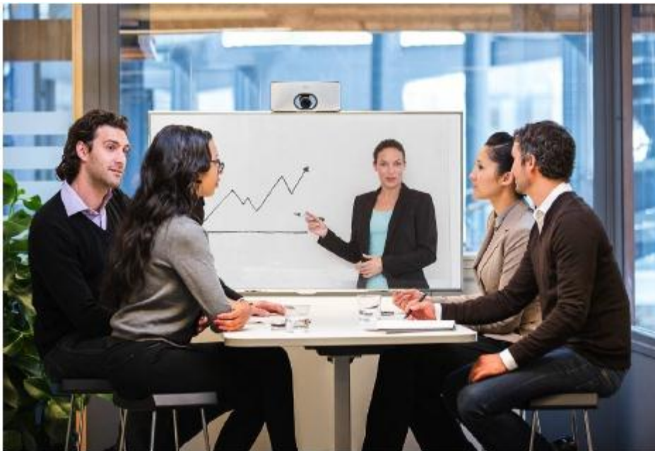
图 1. 项目会议室环境中的 Cisco TelePresence SX10

SX10 Quick Set 将高质量、简单性和经济性结合到一起，为普及视频打造了一种可行的解决方案（图 1 至图 3）。